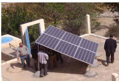
Unité voltaïque de pompage

Une convention de partenariat avec l'ORME engage l'association du douar à tenir une comptabilité transparente, recettes, dépenses, à désigner un homme du village pour la surveillance et l'entretien.