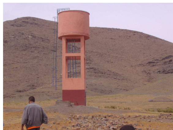
Douar Azzouz El Koba