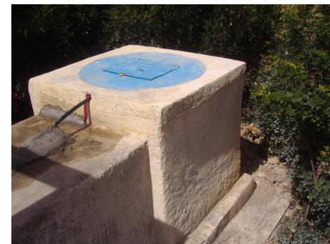
Puits à Ouled Saïd

→ Les études techniques, le suivi-contrôle des chantiers sont réalisés par les techniciens et ingénieurs en hydraulique des services EAU provinciaux.