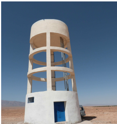
Château d'eau Tassa

→ Notre premier partenaire : l'association des Villageois. Elle garantit la pérennité des équipements d'AEP et la bonne gestion de l'eau.