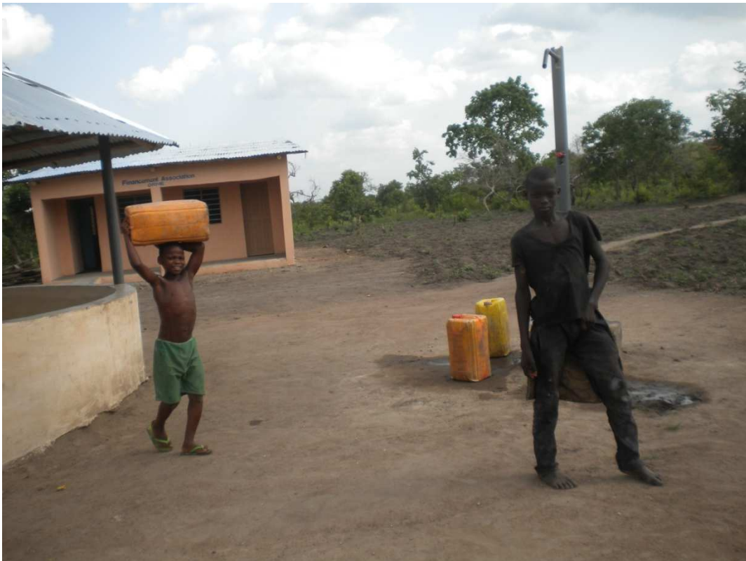
Ci-jointe la photo du robinet pour servir de l'eau à la population.