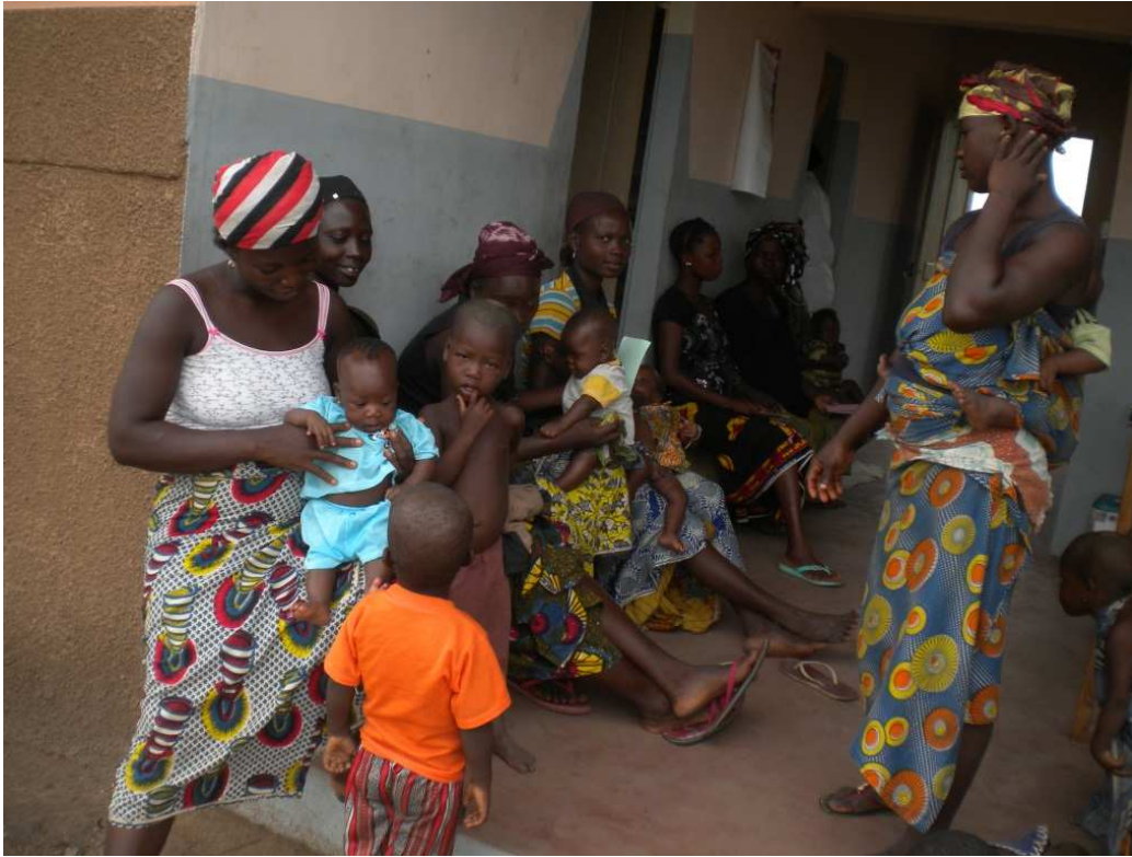
- Ci-jointe la photo d'une séance de vaccination