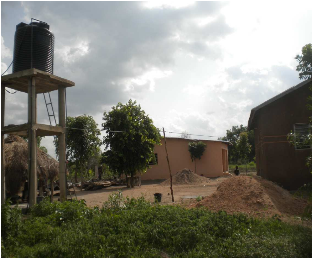
Ci-jointe la photo du forage et du mini château financés intégralement par l'Association ORME.