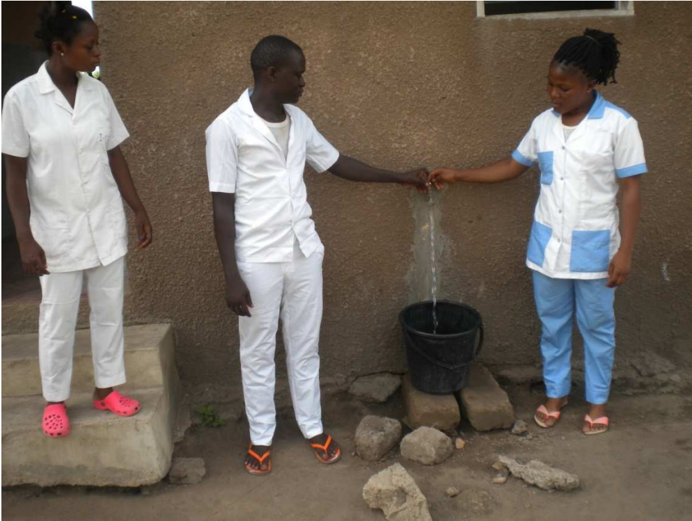
Ci-jointe la photo du robinet du centre de santé pour servir l'eau au personnel soignant.